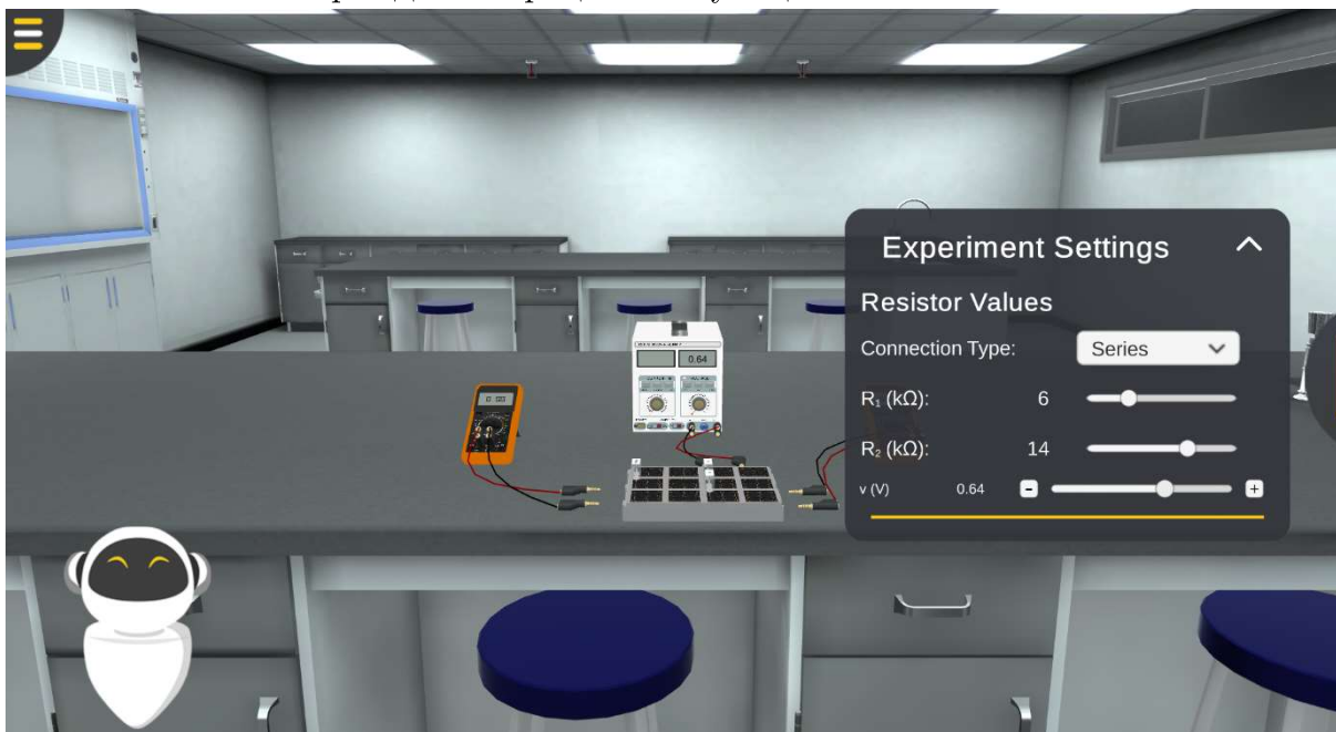
Рис. 2. Лабораторне дослідження закону Ома для ділянки кола в віртуальній лабораторії PraxiLabs

Не менш цікавим, але нажаль не безкоштовним у використанні, є ресурс PraxiLabs ( https://praxilabs.com/ ). Ресурс містить електронні освітні ресурси у вигляді віртуальних 3D симуляцій виконання лабораторного дослідження (див. рис.2). Формат освітніх ресурсів дозволяє їх вбудовування у популярні системи керування навчанням (MOODLE, Blackboard LEARN та інші) використовуючи технологію Learning Tools Interoperability (LTI). Ознайомитись з можливостями ресурсу PraxiLabs можна через демонстраційні симуляції.