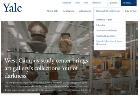
Рис. 1. Сайт Yale University